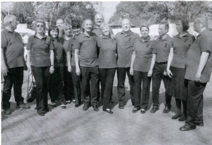
Mit einheitlichen Shirts zeigt sich die Tanzsparte in der Öffentlichkeit.